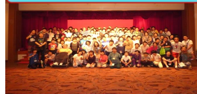
参加者101名 (利用者73名 職員25名 ボランティア3名)