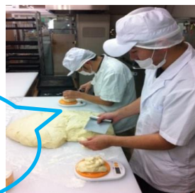
出来立ての生地を分割