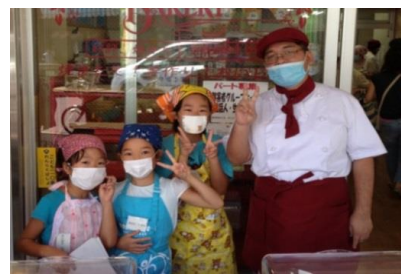
(子安小学校の生徒さん達 9月20日)

近隣の小学校の生徒さん達がパン作りを体験してくれました。小学生たちの手作りのチラシが好評でたくさんパンを販売してくれました。