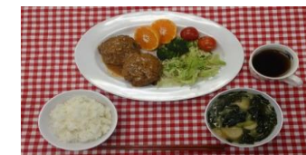
手作りハンバーグ