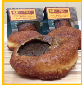
欧風ビーフ カレーパン