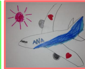
(作画：星野伊与那さん)